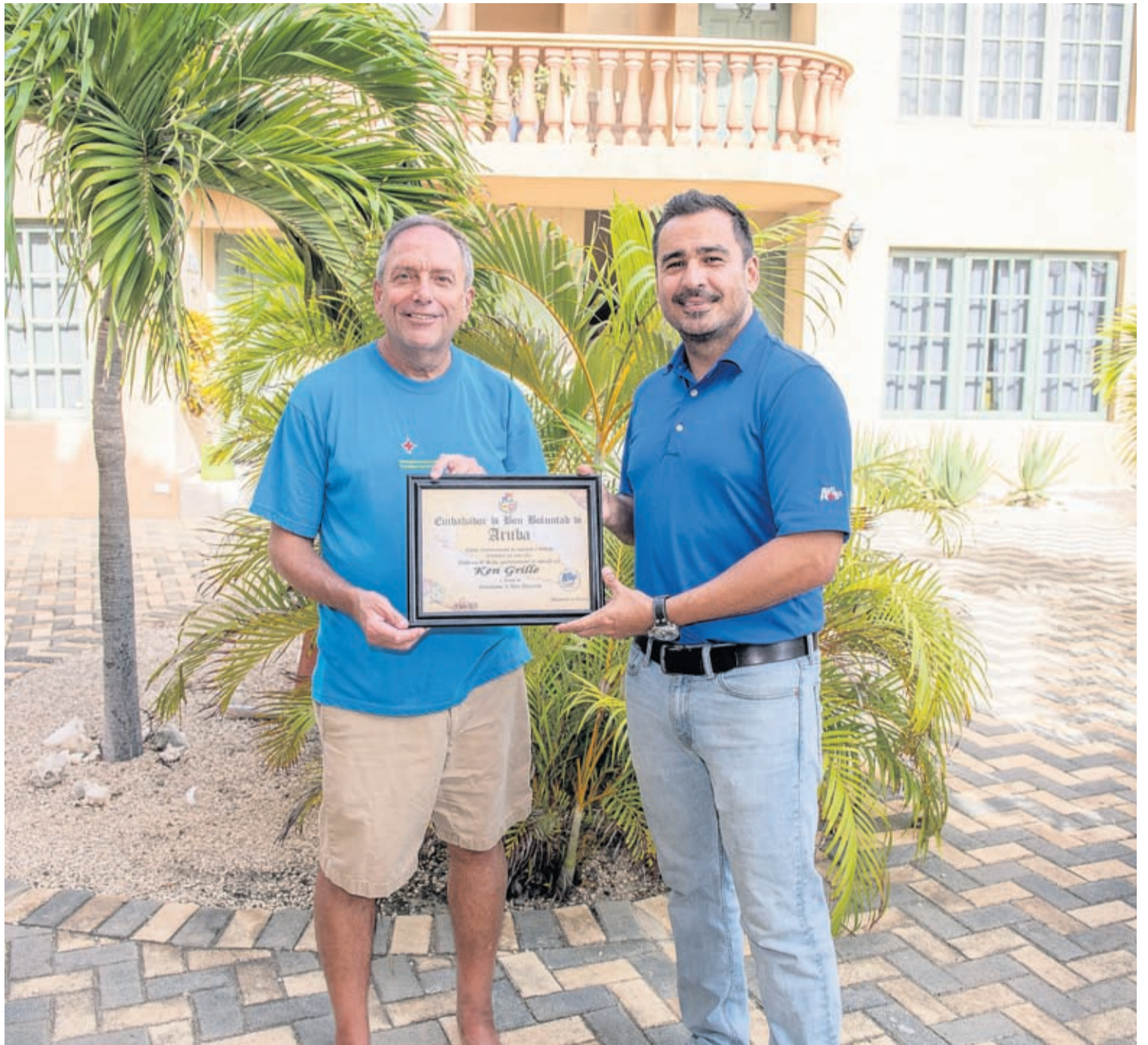
In recognition of his continuous support and promotion of Aruba, the A.T.A. presented him with a 'Goodwill Ambassador' certificate as a way to say 'Masha Danki' for continuously choosing, supporting, and promoting Aruba as a favorite vacation destination. □